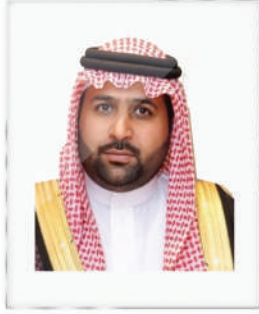
صاحب السمو الملكي الأمير محمد بن عبدالعزيز محمد بن عبدالعزيز نائب أمير منطقة جازان