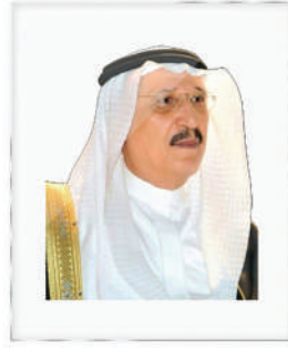
صاحب السمو الملكي الأمير محمد بن ناصر بن عبدالعزيز آل سعود أمير منطقة جازان