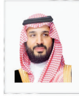
صاحب السمو الملكي الأمير محمد بن سلمان بن عبدالعزيز آل سعود ولي العهد نائب رئيس مجلس الوزراء